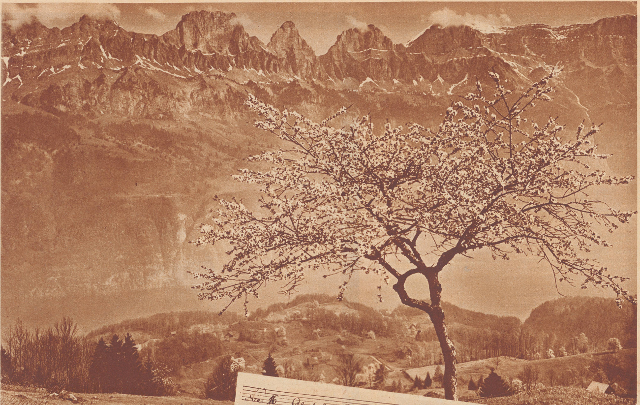
Frühling ob dem Walensee.