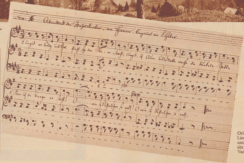
Originalhandschrift des Liedes «Luegid vo Berg und Thal...» (im Besitz der Stadtbibliothek Vadana, St. Gallen).

Mit der warmen Jahreszeit, die mit Sonnenkraft und Frühlingsglanz in den Bergwinter einbricht, erwacht in Talern und Alpen wieder die Poesie der Alphornklänge, der Lieder, Jodel und Herdenglocken. Von allen Liedern, die nun wieder erklingen werden, ist «Luegid vo Berg und Tal» gewiß eines der schönsten. Wer schuf die Melodie, und wer ist der Dichter dieses Liedes, das man schon das schönste Mundartgedicht genannt hat?