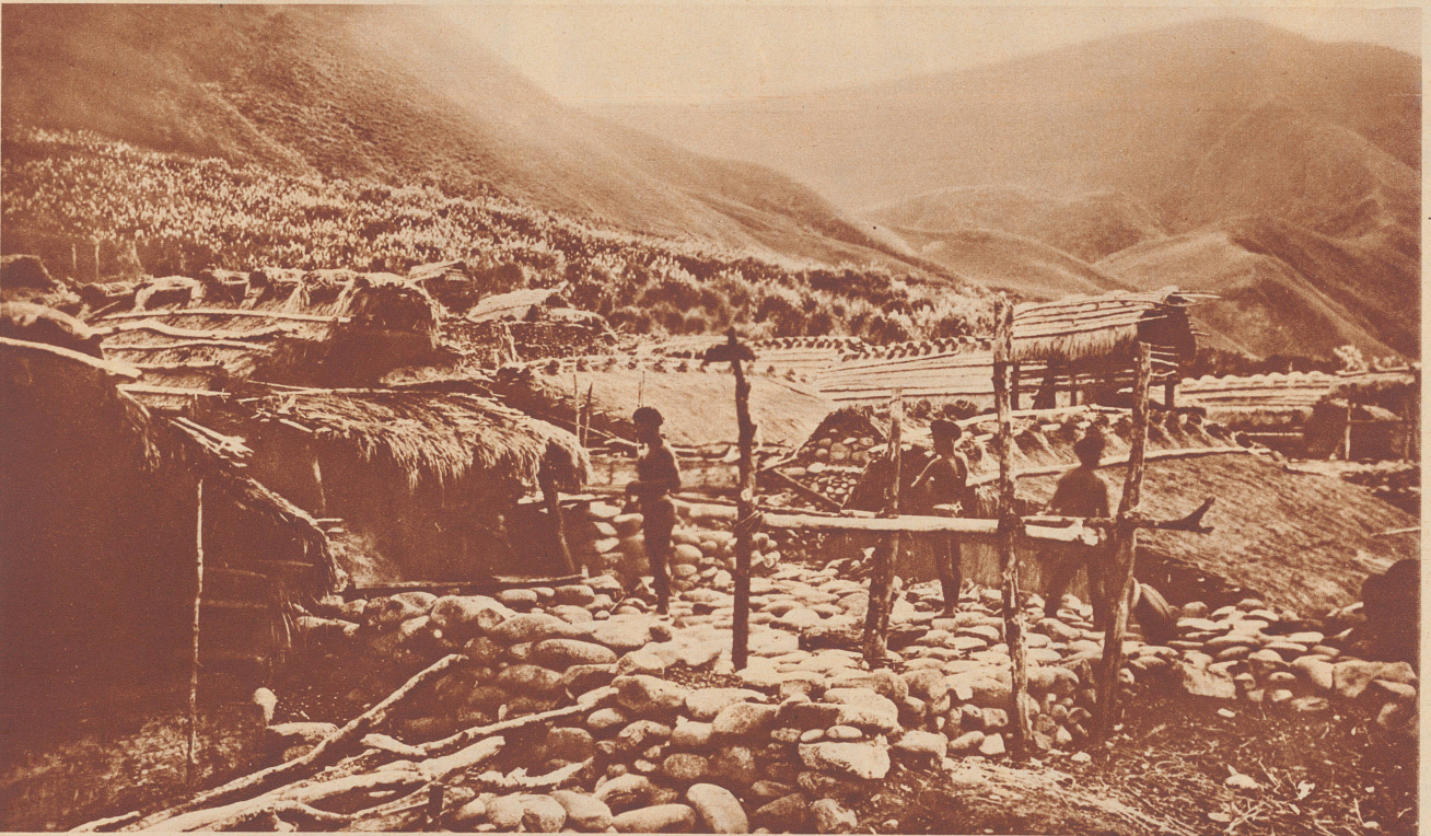
Eingeborenensiedlung beim Stamme der Jami, im Innern von Formosa. Im Gegensatz zu den Städten haben diese Eingeborenendörfer durch das Erdbeben wenig gelitten. Die luftig gebauten Hütten sind wohl auch eingestürzt, aber die leichte Bauart forderte weit weniger Todesopfer.