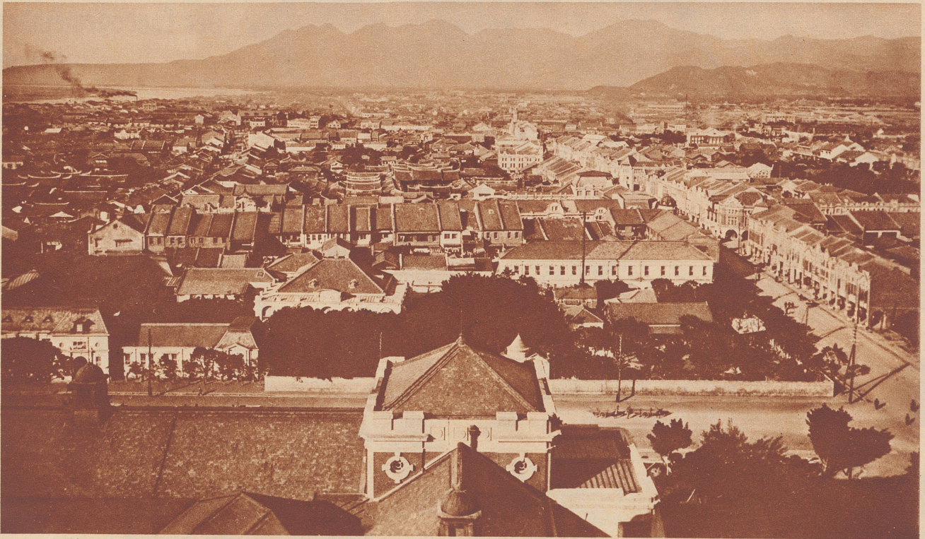
Blick auf Taihoku, die Hauptstadt von Formosa. Die Stadt gehört mit zu den am schlimmsten betroffenen Orten. Teile davon sind buchstäbliche Trümmerfelder geworden. Selbst festgebaute steinerne Häuser hielten den wuchtigen Erdstößen nicht stand, sondern stürzten ein.