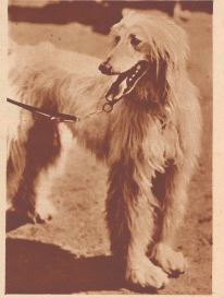
«Ums Singh of Gredra» ist sein Name, ein afghanischer Windhund.