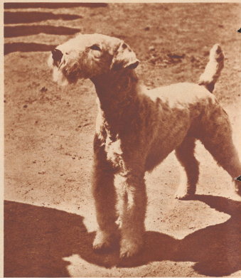
Das mal heißt er nicht Bobtail, sondern goldschwarzer: «Vitz» der Sunny Spot, ein raubhaariger Pomeraner in der Ohrlaut einer Dame, die ihn selber gezeugt hat. Er wohnt in Muttens. Wenn sein Schilfer Schwarz und Braun nicht gerade so wie es in im weißen Grund des Fell verteilt gewesen wäre, so hätte Vitz den ersten Preis nicht bekommen. An solchen kleinen Dingen kann ein Sieg hängen. Bei den Skifahrern, Rennreitern und Automobilsportlern sind's die Sekunden.

Einundzwanzig Siegeltitel wurden bei der Internationalen Hundausstellung in Langenthal verliehen. Es gab aber keine Lorbeerblätter oder Cups, sondern Hundekuchen oder höchstens ein Beefsteak für die einundzwanzig Hundesieger oder Siegerhunde, die da aus den 800 Teilnehmern durch eine sachverständige Hunde-Jury ausgesucht wurden. Die Spitzer, Dackel und Bernhardiner lassen wir diesmal weg. Unsere Bilder geben ein paar seltene Rassen in schönen Mustern, wie man sie niemals am frühen Morgen an der nächsten Haasecke trifft.