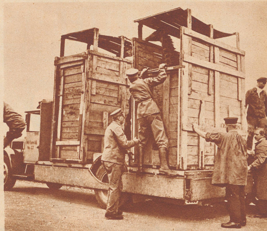
Am Zürcher Bahnhof werden sie auf große Lastautos verladen. Nocheinmal kurze Wegstrecke und endlich — endlich — nach langen Wochen haben sie wieder festen Boden unter den Füßen.