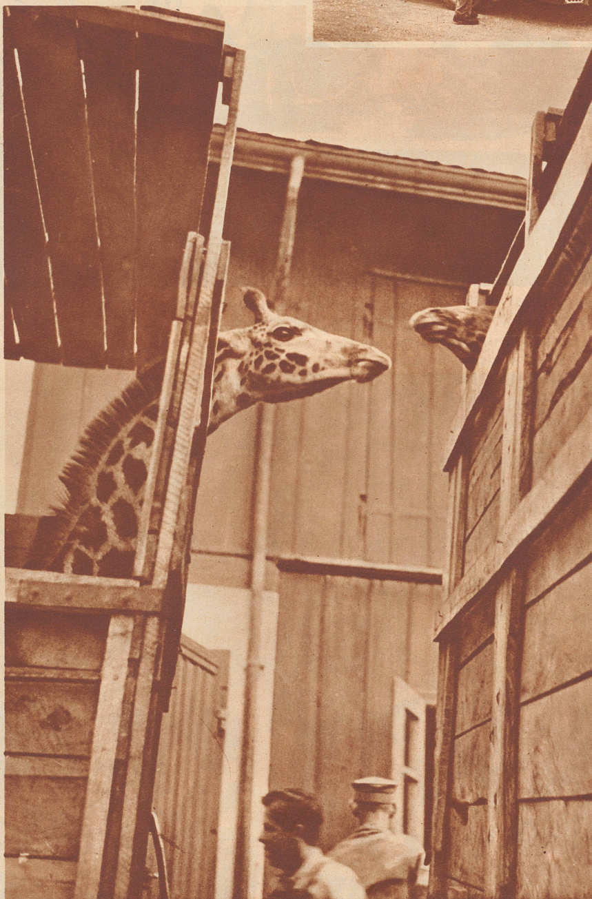
Den Giraffen ist es nicht ganz geheuer. Aengstlich strecken sie die Häuse aus ihren Verschlägen.