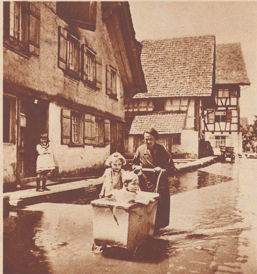
Spazierfahrt mit dem Kinderwagen durch die Hauptstraße von Ermatingen.