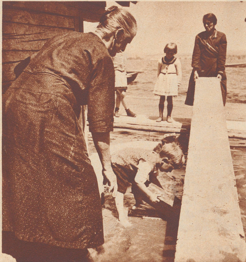
Notstegebau in einer Straße von Ermatingen.