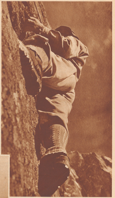
Nach dem ersten großen Eisgang und nach dem ersten mühsamen Stufenkletterer beginnt eine exponierte Kletterei an dem ersten Turm.