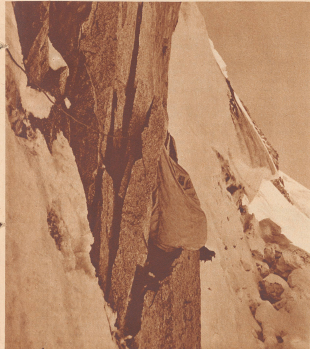
Wie man an der Nordwand der Grandes Jorasses bewahrt, Haupterfordernis steinschuhförmiger Bequemlichkeit kommt zu zweiter Stelle. Eine Art großer Schlüsselschuh wird wie ein Kalfederer über beide Toornisten gestülpt. Das Ganze vorher mit Seil und Haken weiter oben gesichert. Ein Zehlfußsteifer erlaubt nach dem Sturz zu stehen, wenn welche sichtbar sind. Die Schuhe des einen Gister sind rechts unter dem Schlafsaal zu sehen, die Beine des andern liegen in der kleinen Felsspalte. Handerte von Meten stürzt unter ihnen der Berg in Eisklagen und Felsstürzen zum Gletscher hinunter. Er wird förmlich nach bei schönen Wettern, Schafen abgeteilt, Mandarinnaria und Schwarzen müssen über die Stunden hinweggehen, bis der Himmel Licht der Wetterreiter erhebt. Am Morgen nach diesem Bivouak der zwei Münchner lagen 10 cm Schnee auf dem Nachtsack.