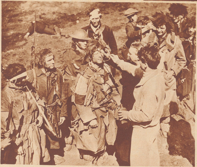
dazu nicht erst des grausamen verbrecherischen Irrsinns eines kriegerischen Vernichtungsaums bedürfte. Bild: Arbeitslose Grubenarbeiter werden für den Film hergerichtet. Der Wells-Film bietet einigen tausend englischen Arbeitslosen vorübergehend Beschäftigung und Brot.

H. G. Wells, der namhafte englische Schriftsteller, arbeitet zusammen mit dem bekannten Regisseur Alexander Korda an einem Film, dessen Herstellung 200 000 englische Pfund kosten soll. Nicht diese Unsumme ist es, die neugierig macht, sondern die Erwartung, die man an ein Werk knüpft, dem ein Mann wie Wells seine Mitarbeit leiht. Vorderhand weiß man, daß der Film den Zukunftskrieg und einen damit verknüpften Zusammenbruch der heutigen Welt darstellt, aus dem heraus dann aber sich ein neues glückhaftes Menschendasein entfalten wird. Wells möchte filmisch dartun, daß das Paradies auf Erden schon heute verwirklicht werden könnte und daß es