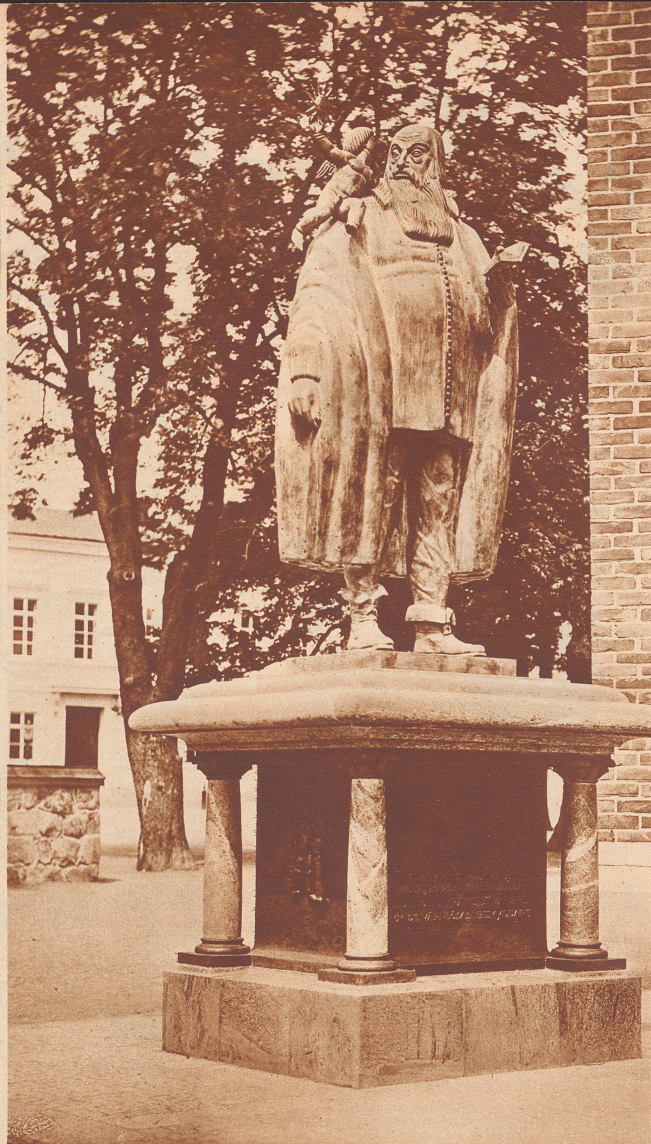
Rudbeckiusdenkmal in Vasteras.