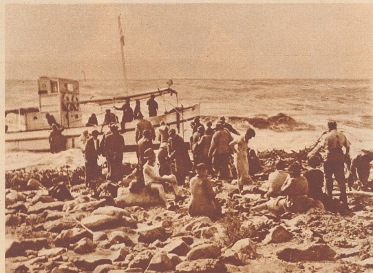
Das Touristenschiff im Kampf mit den Wogen. Der größte Teil der Passagiere hat sich schon aufs Trockene gerettet; andere sind eben im Begriff, das Schiff zu verlassen. Alle kamen mit dem Schrecken und dem Verluste einiger Reiseutensilien und Kleider davon...

Wo wir auch sein mögen, zum Fragen ist jetzt keine Zeit. Wir wissen nur, daß wir festen Boden unter den Füßen haben... Wie angewurzelt stehe ich da, meine Kamera fest in die mitgenommene Decke gehüllt... Ist es Wirklichkeit, ist es ein Traum, daß gegen 50 Menschen, die eben noch lachten, scherzten und fröhlich waren, hier an der Küste Transjordaniens Schiffbruch erlitten?... Dann erwache ich aus meinen Träumen, als ich sehe, daß jemand seine Kamera in Bereitschaft hält, und entsinne mich, daß auch ich die meinige noch bei mir habe — knipse, knipse, so oft es noch geht, hänge meinen durchnäßten Rucksack um und beginne eine stundenlange Wanderung längs der unwirtlichen Küste.