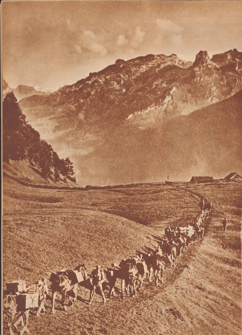
Vorne in eine Schlucht im Goppo die Sanitätskompagnie rück im Kampfgebiete vor. An der Spitze der Kolonne marschieren die Träger. Ihnen folgt dann aufgeschlossen der Sanitätsrat. Er führt auf Pferden gewisse die notwendigen Werkzeuge, Zeh- und Sanitätsmaterial für die Erhaltung eines Verbandsplatzes mit sich.

Heute wird den kämpfenden Truppen die erste sanitäre Hilfe durch das den Gefechtsgruppen zugehörige Sanitätspersonal geleistet, das immer in enger Fühlung mit seiner Truppe bleibt. So folgt im Gefecht z. B. jedem Infanterieregiment ein Sanitätszölkler, der in der Lage ist, bei heftigeren Verletzungen den ersten Nothverband anzulegen, das Zurückschicken der Verwundeten aus der Frontlinie erfolgt auf Anweisung der Truppenärzte. Die Truppenärzte sammeln die Verwundeten in sogenannten Verwundetenlagern in einigermaßen geschützten Stellen des Gefechtsfeldes, nach dem Abzug der Nothverbände folgt sie aber sofort ihrer Truppe wieder nach. Die weitere Pflege für die Verwundeten geht nun automatisch an die den einzelnen Kampfabschnitten oder Kampfgruppen zugehörigen Sanitätskompagnien über, die von einem rückwärtigen Verbandsplatz das Gefechtsfeld systematisch nach Verwundeten abzusuchen und sie dorthin zurückzuführen haben. — Unser Bildbericht orientiert über den Dienst einer solchen Sanitätskompagnie, der, obwohl nicht zu den eigentlichen Kampfhandlungen gehörend, doch von ungeheurer Wichtigkeit für die Armee ist.