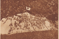
Die Verband-Zeit der Kompagnie. Die Zeit kann in knapp 10 Minuten aufgestellt werden. Gegen Fliegerrisiko ist es mit Bandagen markiert. Hier werden die eingeleiteten Verwundeten je nach dem Grade ihrer Verletzung gesondert und weiterbehandelt.