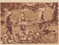
Gruppenweise führt die Sanitätskompagnie mit den gefundenen Verwundeten zum Verbandsplatz der Kompagnie zurück. Die Schwerverwundeten wird auf der Bahre getragen, zwei Leichtverwundete marschieren mit. In der zweizelligen Ordnungstragebahnen besten die schwerere Sanitätskorps ein Gerät, das allgemein als die beste Armer-Tragebahre der Welt anerkannt ist.