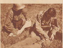
Ein Verwundeter mit einem Beinbruch ist von einem Träger Hilfeleistung herbeigeführt. Mitunterer begeben sie sich in dem Verwundeten den ersten Nothverband. In diesem Falle bezieht er in der Frontlinie die weiteren Hilfeleistungen. In das geschickte, was die Verwundeten sorgfältig auf die bereitgestellten Tragebahnen geladen. Sein Fortschritt kann dabei als zweckmäßige Kopf-unterstützung dienen.