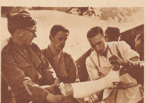
Der Korpsrat mit dem gebrauchten Untersuchenfeld erhält noch im Operationsfeld auf dem Kompagnie-Verbandsplatz einen Gipfelverband. Nachher wird er im Krankenwagen ins Spital abtransportiert.