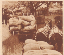
Das sind keine Bergbauern, sondern Landwirte, die einige Jucharten ihres Besitzes mit Weizen, Gerste, Roggen etc. bebauen. Mit Zwergpferden, Brechen- und Leiterwagen bringen sie das Erzeugnis ihrer Ernte zur Abnahmestelle.

Der wichtigste Mann bei der Getreideübernahme: der Prüfer. Probeweise genommen er den Sack eine Handvoll Getreide, steckte daran, litt es durch die Finger reizen und legt es dann auf die Hebelwaage zum Feststellen, ob der Feuchtigkeitsgehalt den Vorschriften entspricht. Er hat eine feine Nase und kann von weitem riechen, ob das Korn Brandig ist, kann sagen, ob es im Isären oder Leimboden gewachsen ist und ob es bei gutem oder schlechtem Wetter geerntet wurde. Nach seinem Befehl wird der Preis festgesetzt.