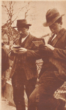
Die beiden haben den Preis für ihre Ablieferung schon anstandslos erhalten. Jetzt prüfen sie nach, ob die Rechnung stimmt.

ungeheuren Getreideüberfluß zu registrieren hat, in die Förderung des Getreidebaus ein zweischneidiges Schwert im wirtschaftlichen Kampfe. Der Bauer mußte unbedingt garantieren, daß er für sein Getreide auch dann Absatz fand und zu einem Preise, bei dem er betreiben kann. Wer sollte diese Garantien übernehmen? Der Bund. Mittler der Schweizer Bauer sein Getreide zum Weltmarktpreis abgeben, es würde für ihn den Reim bedeuten. So sah sich unser eidgenössisches Parlament vor die verwegende Tatsache gestellt, unserer Landwirtschaft einen Überpreis über den Weltmarktpreis zu gewähren. Der Bund wurde zum Großeinkäufer. Der Bauer fährt heute sein Getreide nicht mehr mit Rod und Wagen nur in die Mühle, sondern speziellen Güterwagen bereit, das Getreide aufzunehmen, nachdem es von den Beamten des Bundes aufs sorgfältigste geprüft und kontrolliert und gewogen worden ist. Damit sich der Leser ein ungefähres Bild von der Arbeit machen kann, die die Getreideübernahme verursacht, sei hier bloß erwähnt, daß im Jahre 1934 total 12800 Eisenbahnen zu 10 Tonnen verladen und abgeholt worden sind. Die Eidg. Getreideverwaltung hat also reichlich Arbeit. Der ganze Ankauf, das Verladen auf den unzähligen Bahnstationen, die Entlager in die Mühlen und Lagerhäuser muß gut vorbereitet und organisiert sein, um den Betrieb reibungslos abwickeln zu können. Unsere Bilder stammen von einer solchen Getreideübernahmestelle am Thunersee.