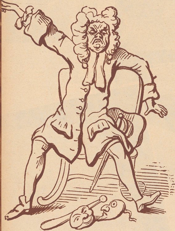
Heidegger in Wut.

«Surintendant des plaisirs de l'Angleterre»