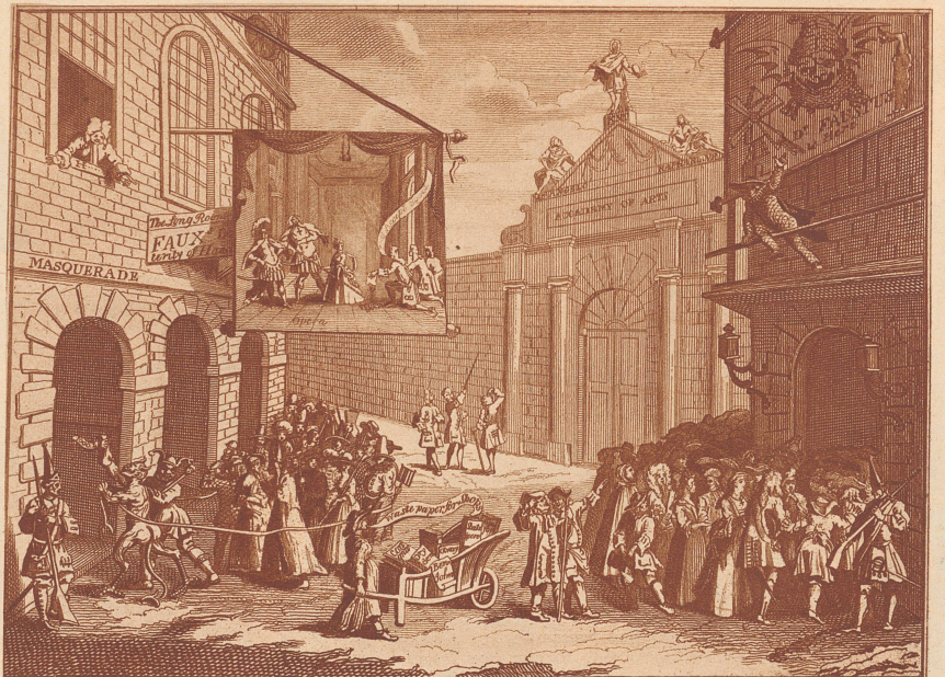
Hogarth karikiert Heideggers Wirksamkeit.

Nachdem Heidegger sich bereits als Librettist mit großem finanziellen Erfolg betätigt hatte, kam im Jahre 1713 eine für die Londoner Musikwelt katastrophale