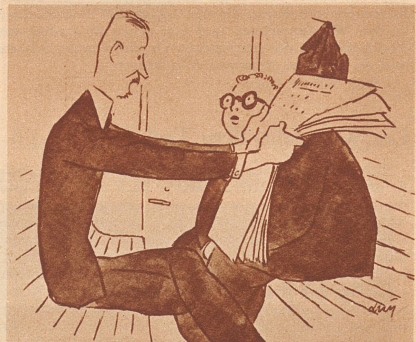
«Mit Ihren Augen geht's auch nicht mehr so recht, Herr Nachbar!»

«Aber Heini, wie kommt denn der furchtbar große Tintenfleck auf dein Heft?» «Das will ich dir sagen, Mutti. Erst waren vier kleine Kleckse auf dem Heft... und nun hat der Lehrer heute gesagt, daß wir für jeden Fleck eine Ohrfeige bekommen... und darum habe ich schnell einen großen daraus gemacht!»