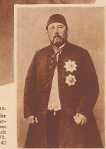
Munzinger Pascha. Eine Aufnahme aus der Zeit der Generalgouverneur des osmanischen Sudan war. Munzinger erhielt dieses Amt im Jahre 1872. Er war damals 40 Jahre alt.