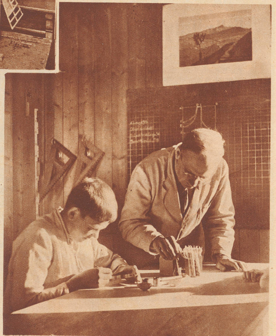
Im Toggenburg macht der Lehrer einer Bergbauerschule mit seinen Schülern ebenfalls Weihnachtssachen. Da werden Kerzen bemalt und Schachteln und kleine Truhen verziert. Die Kinder schaffen mit Begeisterung für das Christkind und können ihren Eltern, die oft sehr arm sind, dafür manchen Batzen heimbringen.

Liebe Kinder! Als Gritli acht Jahre alt war, vernahm es zum erstenmal, daß die schönen Spielsachen, die es an jedem Weihnachtsfest erhielt, nicht vom Christkind, sondern daß die größten und teuersten Geschenke vom Vater und die anderen von Tante Emma, Onkel Rudi und vom Götti gewesen seien. Das stimmte Gritli doch ein wenig traurig, denn es hatte bis jetzt fest an das Christkind geglaubt. Es war doch viel schöner zu denken, daß die Sachen vom Himmel herunterkamen, als wie sich jetzt herausstellte, daß sie im Spielwarenladen gekauft wurden. Aber gewiß war das Christkind dabei, als die schönen Geschenke gekauft wurden, sie waren ja in goldenes Papier gehüllt und mit Silberschnüren festgebunden. Zwei Jahre später vernahm Gritli auch noch, woher die Spielsachen kamen. Es hörte davon, daß es in Deutschland, im Thüringerwald ganze Dörfer gäbe, in denen fast nichts anderes als Spielzeuge hergestellt würden. Wie staunte es, als ihm Vater erzählte, es gäbe da sogar Spielwaren-Schulen, in denen Mäd-