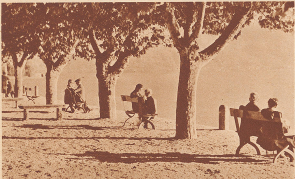
Wie sie im Hochsommer in der Regel aussieht . . .