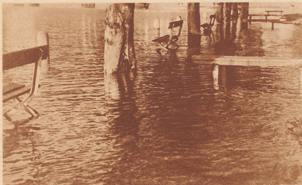
. . . Wie sie sich im Herbst 1935 darbot . . .