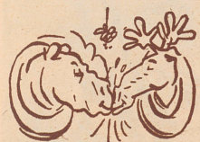
Unter dem Mistelzweig