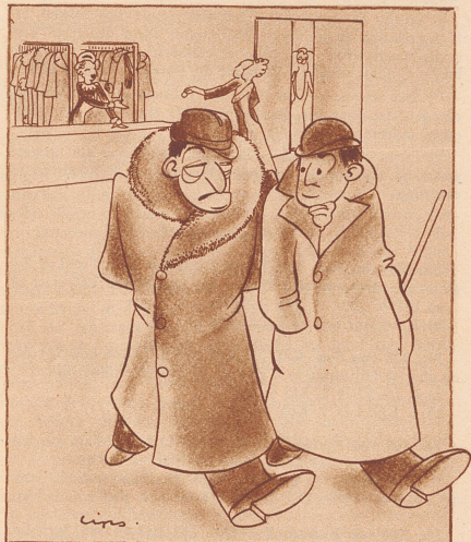
Nach dem Silvesterball.