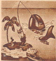
«Schade! Das glaubt mir doch wieder kein Mensch!»

«Ein Glück, daß es vor dem Abwaschen passiert ist ...»