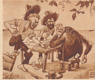
«Es ist doch zum Auswachsen mit dem Kerl! Die ersten drei Jahre hat er überhaupt nichts begriffen — und jetzt betrügt er schon mit den Beinen.»