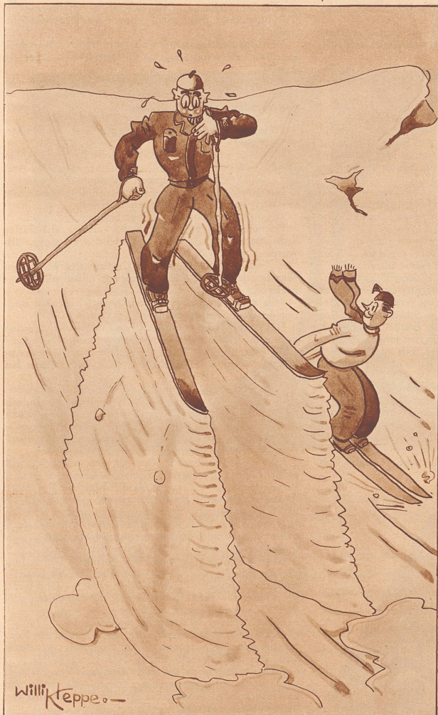
Der Skiläufer, der das Skiwachs vergaß.