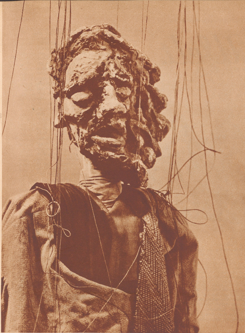
Der verrückte Prophet

Zwei Figuren aus den Marionettenspielen «Judas Ischariot» und «Der Nachlaß» von Erich Weiß. Die Stücke werden vom 1.–12. Februar im Zürcher Kunstgewerbemuseum gespielt werden. Die Marionettenfiguren hat der Verfasser selber entworfen und in mehrjähriger Arbeit ausgeführt. Sie zeichnen sich neben ihren formalen Besonderheiten durch ungewöhnliche Größe aus. Etwa dreißig dreiviertel lebensgroße Figuren hat er für seine zwei Stücke gebaut. Die Bühne verlangt dementsprechend ungewöhnliche Ausmaße. Die Freunde des Verfassers, etwa 20 Studenten, sind seine Helfer und Sprecher und Figurenführer.