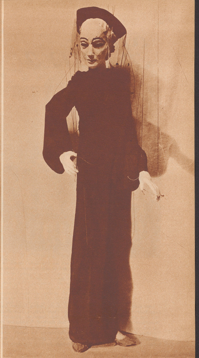
Die Tochter des Dichters

zum Beispiel einen kleinen Apparat, der die Größe eines Fußes hatte; er wurde eingegraben und mit Erde bedeckt. Der Schauspieler, der auf sein Pferd zulief, trat auf den verborgenen Apparat und sprang dann mit Leichtigkeit in den Sattel.