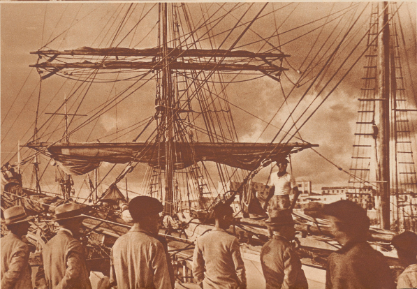
Im Hafen von Lissabon. Ein Blick auf den großen Segler vorer den tropischen Sonne über in die große leuchtende Vergangenheit Portugal, in die Zeit, da diese berühmten Seefahrer Diego Cao, Alvarez Cabral, Bartholomäus Diaz und Vasco de Gama ihre klugen Fahrten über die Ozeane anführten, diese Länder entdeckten und in Afrika, Indien und Südamerika eine Handelsbahnlinien für das Mutterland schufen.