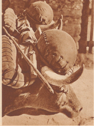
Der ledere Koyfischmak. Das schwerfällige Nadelgehölzpolster einen Ochsengepannen, das von der Landeshut Wien in die Sech führt.