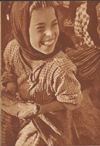
Fischmarkt auf dem Fischmarkt von Lissabon. Altm um der schwarzen Augen und der leuchtenden Lächeln will man ihn für ein paar Escudos ab.