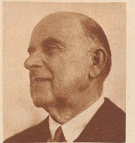
† Prof. Dr. Karl Moser bekannter Schweizer Architekt, 1915–1928 Dozent für Baukunst an der E.T.H. und Ehrendoktor der Universität Zürich, starb 76 Jahre alt.