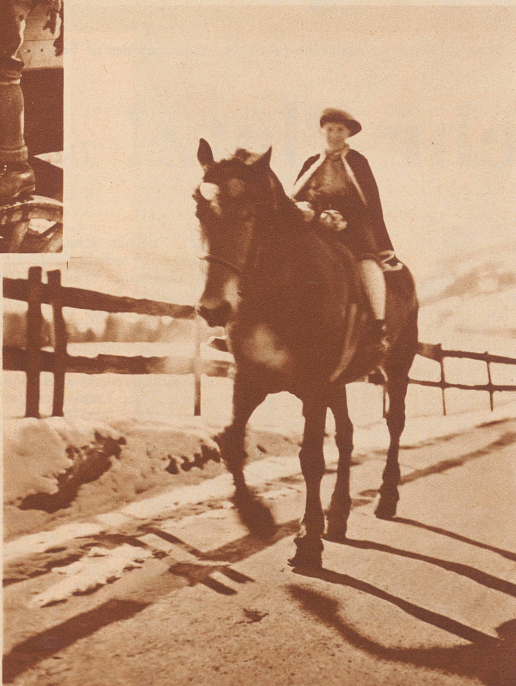
Dem Zuge voran reitet in schwarzem, flatterndem Mantel der Vorreiter oder Herold.