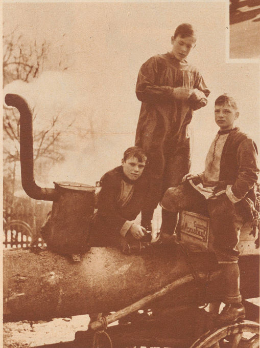
Ueber Mittag haben die Hundwiler Buben eine Wache von drei Mann aufgestellt. Diese muß den «Bloch» vor den neckenden Herisauer Buben schützen. Sie ist verpflichtet, deren Witze und Sticheleien zu erwidern und Hiebe auszuteilen, wenn es schließlich zu bunt wird.