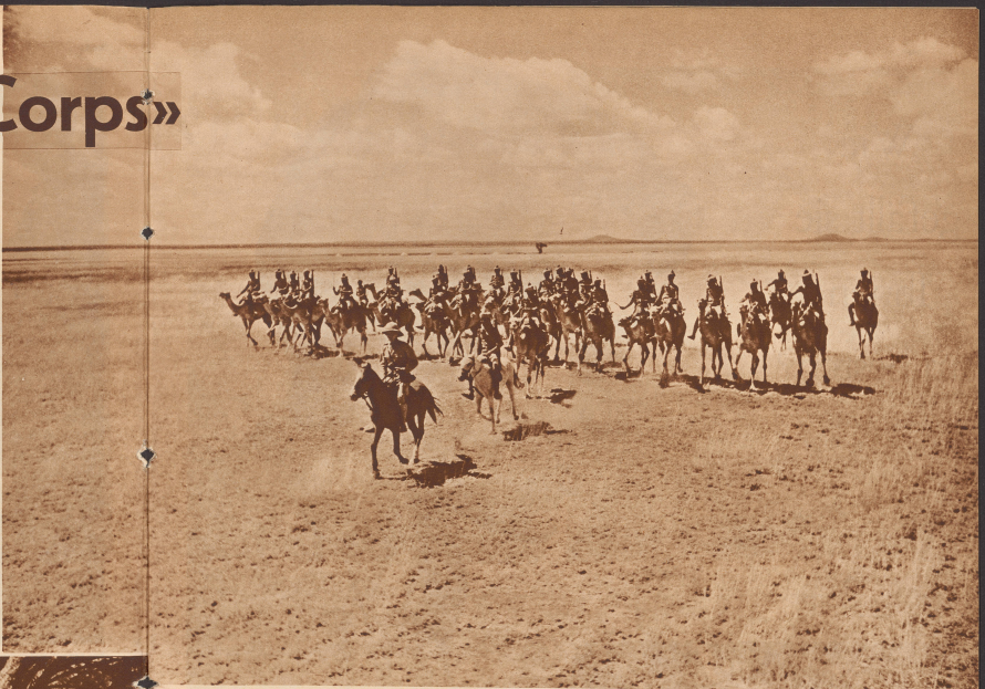
«Somaliland-Kamelreiter» beim Exzertieren in Zugformation in der zugehörigen Tugwajah-Suppe in der abessinischen Grenze.

Offizierspatrouille eines Bataillons des Somaliland Kamelreiter-Korps an der abessinischen Grenze. Der weiße Patrouillenführer ist zu Pferd, was darauf schließen läßt, daß dieser Katt nicht sehr lange dauere. Pferde sind in diesem Klima nicht sehr leistungsfähig, Kamelreiter können 80-100 km täglich vorwärtskommen.