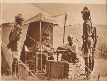
Zählung beim «Somaliland Kamelreiter-Korps». Jeden Sonntag erfolgt durch einen Offizier die Sollauszahlung.