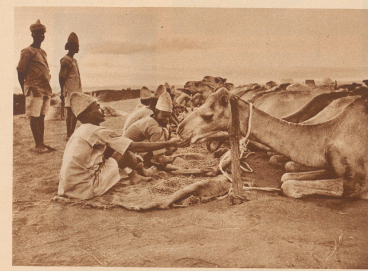
Aberdunk einer Kompanie des «Somaliland Kamelreiter-Korps». Nachdem Waffen und Ausrüstung gereinigt sind, bekommen auch die Kamel ihre Pflege und ihre Mahlzeit. Liebervoll rechen die Soldaten ihren Tieren die Futter, das sie auf einem Stock Sackleinwand ausgebreitet haben.