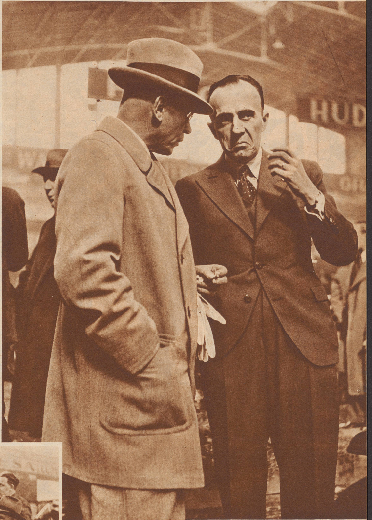
«Ja, anderswo, bei andern Wagen, da mögen Sie recht haben, da fehlt dieses und jenes, aber bei uns, da liegt's ja, bei uns kommen solche Mängel nicht vor!»

Aufnahmen aus dem Genfer Automobilsalon