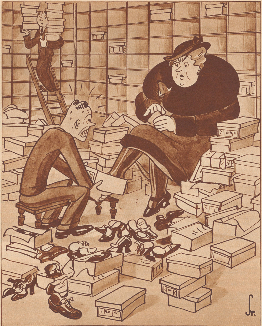
Ein Verkäufer verliert die Geduld.