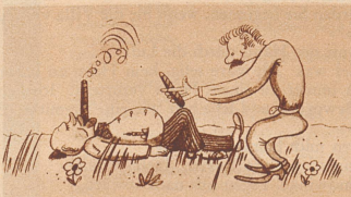
«Gestatten... darf ich Sie um Feuer bitten...?»

Sie wirft ihm einen wütenden Blick zu, winkt dann einem Auto und befiehlt dem Chauffeur mit lauter Stimme: «Fahren Sie mich sofort nach Hause, Seefeldstraße 14, 3. Stock, rechts.»