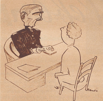
Die Statistik verwirrt die Köpfe.

«Wieviele Kinder haben Sie?» «Drei – aber mehr gib't auf keinen Fall.» «Warum denn nicht?» «Ich habe gelesen, daß jedes vierte Kind, das zur Welt kommt, ein Chinese ist.»