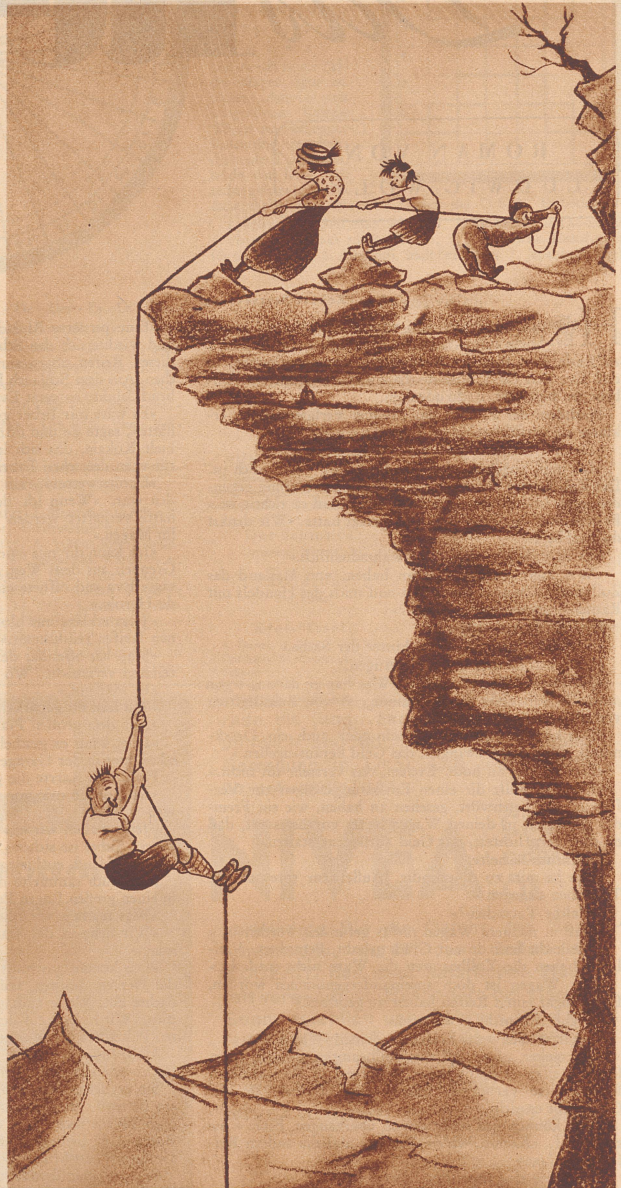
Der Mann, der an seiner Familie hängt.

«Zu meiner Zeit, mein kleines Fräulein, errödete ein junges Mädchen, wenn es sich schämte, aber heute schämt sich ein junges Mädchen, wenn es errödet.»