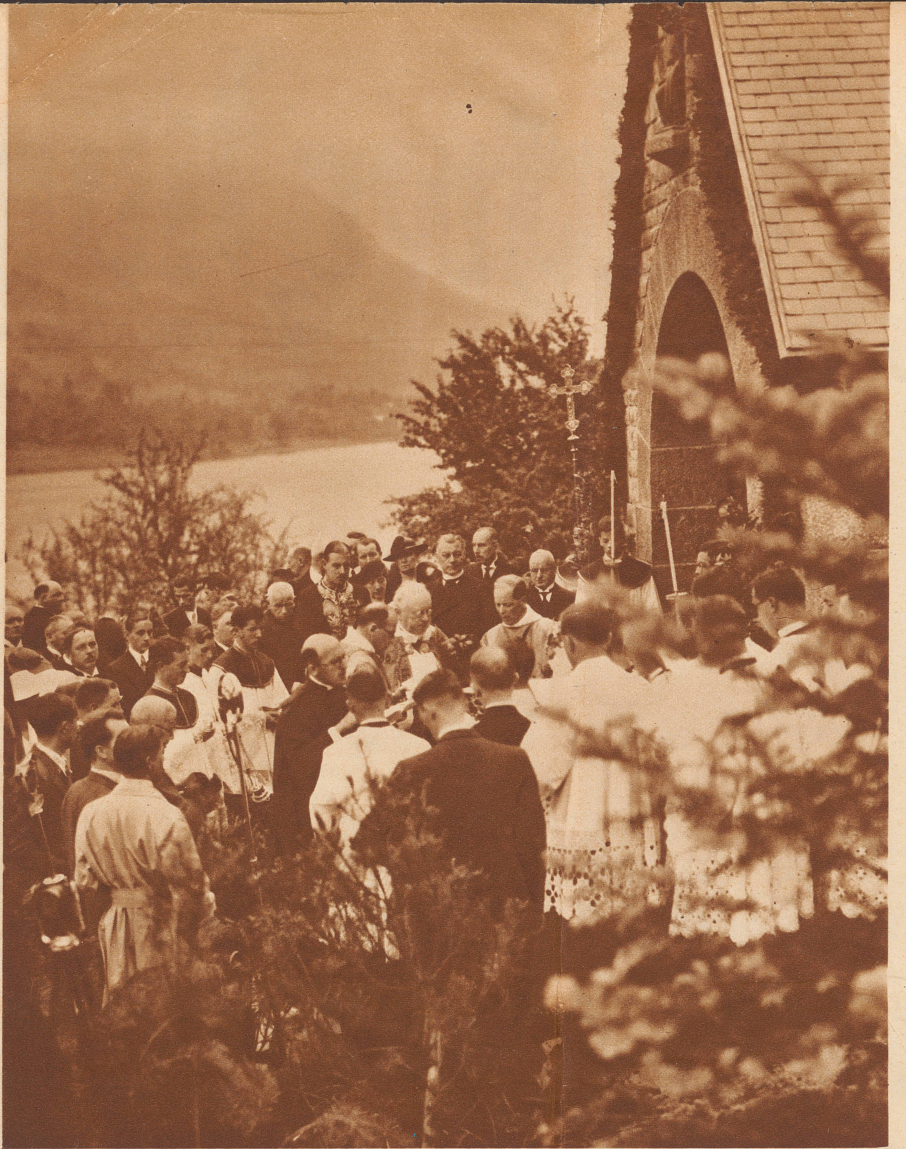
Die Glockenweihe vor der Kapelle. Man bemerkt im Hintergrund Bundesrat Motta, links von ihm Vicomte du Parc, den Vertreter des Königs der Belgier, noch mehr links Graf d'Ursel, den belgischen Gesandten in Bern.