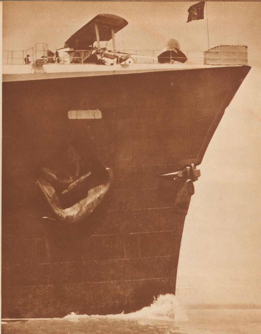
Der Bug der «Normandie» mit dem abgestürzten englischen Bombenflugzeug.

der beliebte Zürcher Frauenarzt und langjährige Dozent für Gynäkologie an der Universität Zürich, feierte vor kurzem seinen 80. Geburtstag.