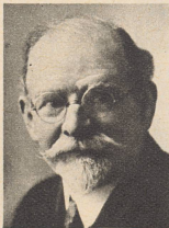
† Emil Vogt Architekt in Luzern, bekannt geworden als Erbauer einer Anzahl bedeutender Hotelbauten in der Innerschweiz, in Italien, in Aegypten und Palästina, starb 73 Jahre alt.