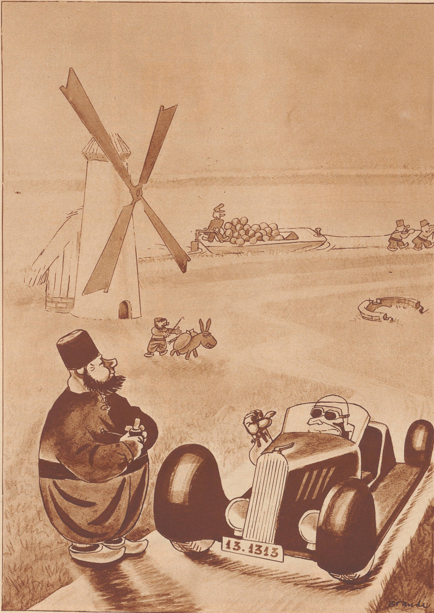
Wiederschen mit Holland.