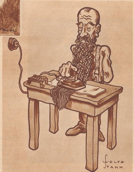
Alle Tage fünf Minuten Bartpflege.

Beredtes Schweigen. «Ich habe noch nie gesehen, daß Sie in der Sitzung überhaupt den Mund aufgetan haben.» «So? Ich gähne doch jedesmal, wenn Sie reden.»