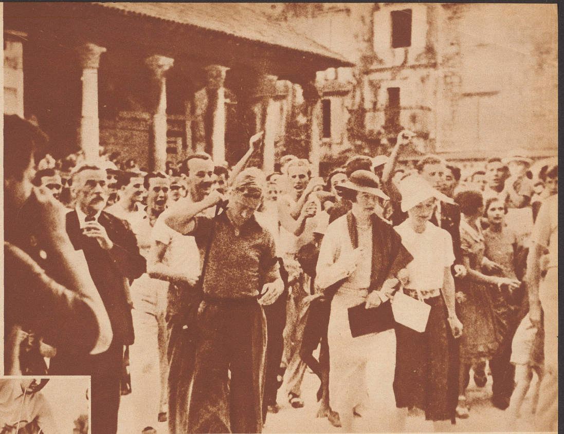
Im dalmatinischen Städtchen Trogir gab es vor kurzem frohe Aufregung wegen eines netten, hemdärmelig-einfachen Ferienbummlers, der durch die Straßen spazierte. Dieser freundliche Herr war nämlich Eduard VIII., König von England. Er versteht es, Ferien zu machen und ist glücklich, daß er nicht immer und überall die äußern Abzeichen seiner Würde herumtragen muß. Wenn er alles abstreifen darf, was Abstand und Unterschied schafft zwischen ihm und seiner Umwelt, wenn er Mensch unter Menschen sein darf, dann freut er sich königlich.