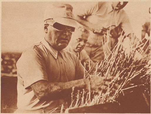
Am 18. Dezember letzten Jahres hat Mussolini die Stadt Pontinia eingeweiht und bei dieser Gelegenheit eigenhändig das erste Saatkorn auf den entsumpften Boden der Gemeinde ausgestreut. Jetzt ist das Getreide reif geworden, eine gute Ernte ist in vollem Gang. Eigenhändig drischt der Duce das erste in Pontinia geschnittene Korn. Mit diesem symbolischen Akt hat das gewaltige Meliorationswerk in den Pontinischen Sümpfen seinen Abschluß gefunden.