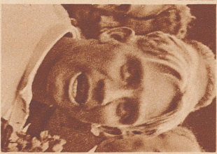
Jeff Scherens (Belgien) gewann zum zweitenmal die Pro- fessionell-Weltmeis- terschaft.