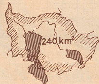
Kartenfläche der 7 ersten Wanderatlanten

Wenn wir die gesamte Kartenfläche unserer ersten 7 Wanderatlanten mit ihren 2250 km 2 in diesem Rechteck darstellen, so nimmt sich darin der Kanton Zug mit seinen 240 km 2 bei gleichem Größenverhältnis so aus, wie auf dieser Skizze.