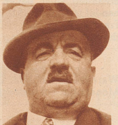
† Hermann Denz einer der ersten Sportphotographen der Schweiz, langjähriger Redaktor und Administrator der Eidgenössischen Schwingzeitung, selber ein bekannter Kranzschwinger und Ehrenmitglied des Eidgenössischen Schwingerverbandes, starb 60 Jahre alt in Bern.