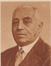
† M. Dizengoff Mitbegründer und langjähriger Bürgermeister von Tel Aviv, starb 76 Jahre alt. Um das israelitische Aufbauwerk in Palästina und den wirtschaftlichen und kulturellen Aufstieg von Tel Aviv hat er sich große Verdienste erworben.