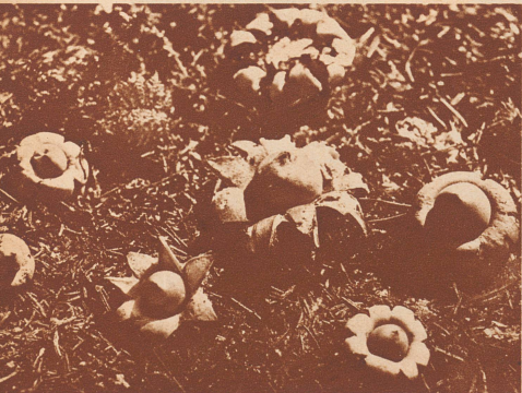
Es gehört ein gutes Auge dazu, den kleinen Erdstern mit seiner gelbbraunen Farbe unter den dürren Tannadeln herauszufinden.