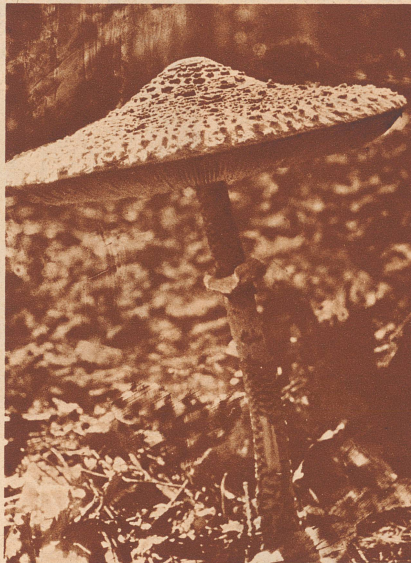
In hohen, lichten Wäldern ist der große Schirmling zu finden, mit seinem geschuppten Hut und dem schön gezeichneten Stiel.

Kaum wenige Wochen sind es her, seit die Sonne ihre größte Bahn gezogen, und schon wieder geht das Jahr langsam seinem Ende zu. Die Tage werden kürzer und kürzer, und Morgenebel verkünden dir den nahenden Herbst. Die Glockenblumen, Margeriten und wie sie alle heißen, sind verblüht, und schon glaubst du, die Natur rüste sich zum Winterschlafe.