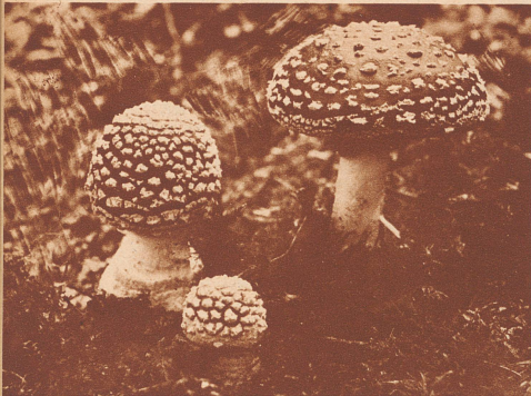
•Einer der schönsten Pilze ist unstreitig der Fliegenpilz mit seinem leuchtendroten Hut, auf dem die weißen Ueberreste seiner Schutzhülle sich prächtig ausnehmen.

Erscheinen zwanglos in der «Zürcher Illustrierten» • Alle für die Redaktion bestimmten Sendungen sind zu richten an die «Geschäftsstelle des Wanderbunds», Zürich 4, am Hallwylplatz