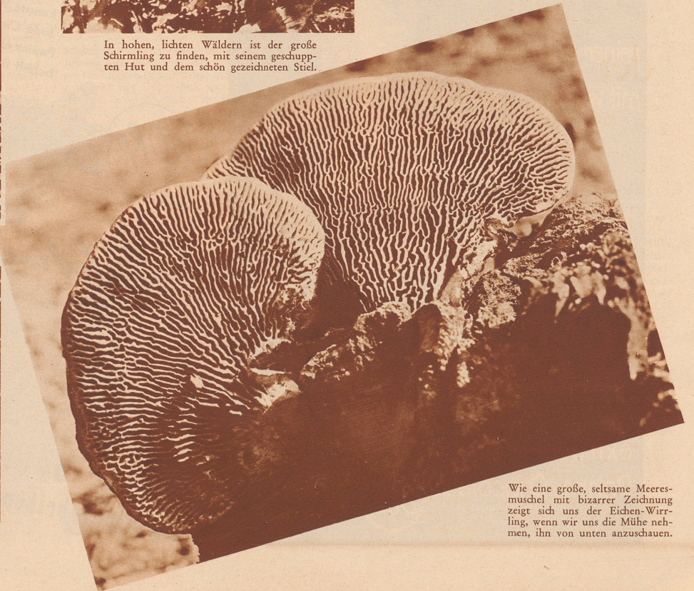
Wie eine große, seltsame Meeresmuschel mit bizarrer Zeichnung zeigt sich uns der Eichen-Wirrling, wenn wir uns die Mühe nehmen, ihn von unten anzuschauen.

Also, da wird dir nur eines helfen können: Die Pilze unter kundiger Führung selbst unterscheiden lernen!