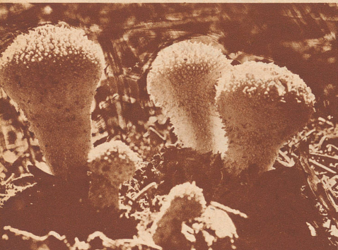
Ein Vertreter aus der Familie der Stäublinge. Seine Haut ist mit zahllosen kleinen Spitzchen besetzt, die dem ganzen Pilz etwas Igelartiges geben.