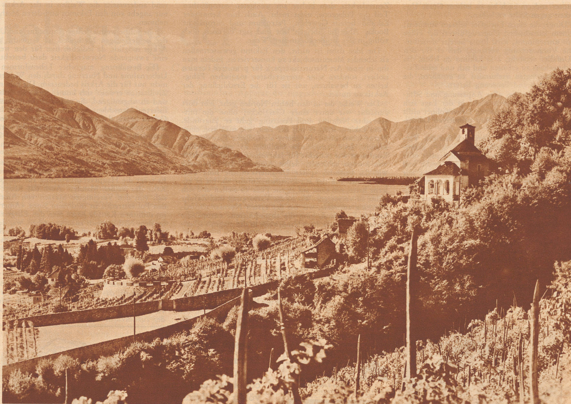
Die Kapelle della Fraccie und die Landschaft von Tenero, die zur Zeit, da die nachstehende Geschichte spielt, von der Pest heimgesucht wurde.