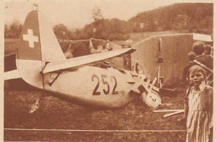
Der abgestürzte, verhältnismässig wenig beschädigte Jagdeinsitzer «D 27/252».

um die Bildung von Wassertropfen hervorzurufen, die dann bei der grossen Kälte sofort einfrieren und die dann von der Erde aus als Nebel wahrgenommen werden.