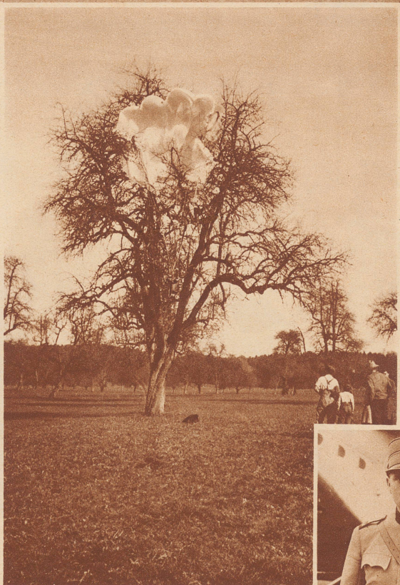
Der Fallschirm verfang sich bei der Landung im Geäst eines Birnbaumes. Von der herbeigeeilten Bevölkerung wurde Leutnant Reber aus dem Fallschirm gelöst und unversehrt erreichte er festen Boden.