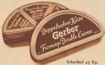
Schachtel 45 Rp.

Wem reifer Käse weniger zusagt, dem mundet besonders