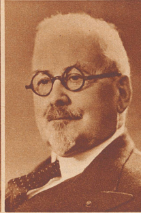
Charles E. Guillaume