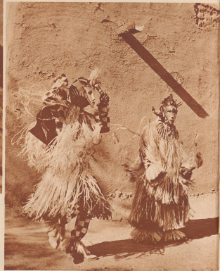
Bambarischer Lachentanz. Danse juvénile.