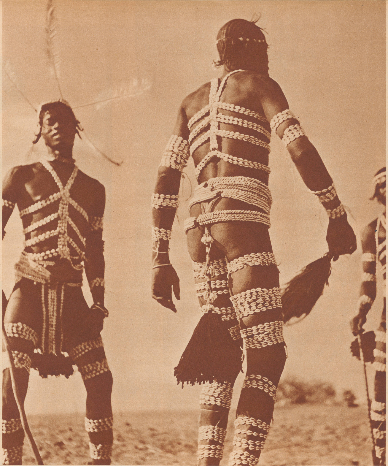
Bambarische Bobos in ihrer malerischen Muscheldekoration bei einem religiösen Tanz.

Danse des bobos bambaras, pour invoquer la pluie et la fécondité du sol.