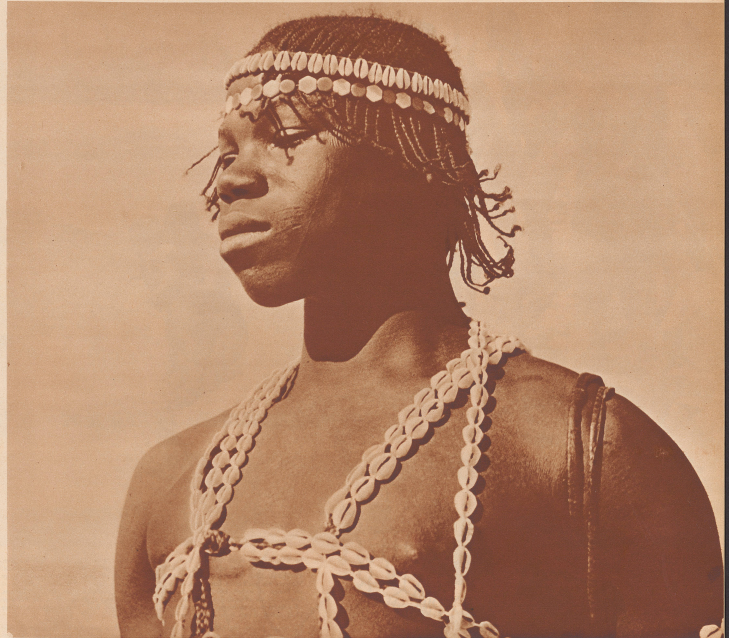
Junger Bambarer, 18 Jahre alt, in seiner eigentümlichen Mundschleimhaut. Diese Mundschleimhaut, die von den Küsten des Indischen Ozeans importiert werden, dienen den Bambaras auch als Zahlungsmittel. Jeune homme bambara recouvert des colliers de coquilles qui figurent l'armature du squelette.

gewachsene Gestalten, sind in der Hauptsache Ackerbauer. Sie pflanzen Erdnüsse, Hirse, besonders aber auch Baumwolle. Dabei ist zu bemerken, daß hier, wie überall in Afrika, die Arbeit, die zu leisten ist, von den Frauen besorgt wird. Die ersten Tempel, mit und ohne Muske, die alle religiösen Ursprünge sind, bleiben den Männern vorbehalten.