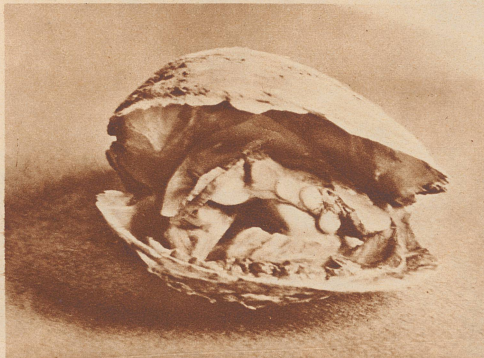
Eine aufgebrochene Perlmuschel mit drei ganzen, echten Perlen. Sie ist in einem Drahtkasten in Japan gezüchtet worden.