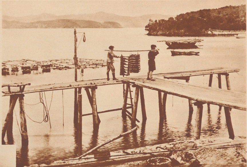
Die Käfige, in denen sich die Perlmuscheln befinden, werden alle halbe Jahre aus dem Meere gezogen, um gründlich gereinigt zu werden. Nach sieben Jahren haben sich echte Perlen in den Muscheln gebildet.

Wißt ihr, wie man echte Perlen gewinnt, die auf dem Meeresgrunde wachsen? Der französische Forschungsreisende Robert Percival hat einmal in Ceylon indische Perlenfischer bei ihrer Arbeit beobachtet. Er berichtet darüber: «Jede Barke dieser Fischer ist mit zwanzig Mann besetzt, die unter einem Kommando stehen. Zehn davon besorgen das Rudern und andere Bootsarbeiten. Die übrigen sind Taucher, die immer je fünf auf einmal in das Meer tauchen, um auf dem sechs bis acht Meter tiefen Grund die Perlenmuscheln loszureißen und nach oben zu bringen. Ihr einziges Hilfsmittel ist ein schwerer, an ein Seil gebundener Stein. Kommt die Reihe zu tauchen an einen von ihnen, so ergreift er das Seil dicht über dem Stein mit den Fußzehen, die diese Eingeborenen wie die Finger der Hand zu gebrauchen verstehen, und springt damit über Bord. Der schwere Stein zieht ihn schnellstens zu Boden. Auf dem Grunde angekommen, hält er sich