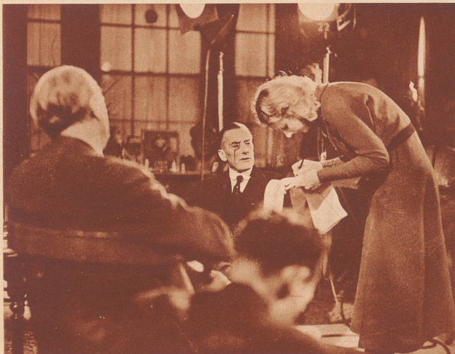
Sir Austen Chamberlain bei einer Sprechübung in der Wohnung des Schriftstellers. Très photogénique, Sir Austen Chamberlain, monocle à l'œil, répète son rôle.

Funérailles soviétiques. Staline (à droite) et derrière lui Kaganowitsch, Molotow (à gauche) et derrière lui Woroschilow transportent les cendres du commissaire du peuple à l'industrie lourde Ordschonikidse, subitement décédé.