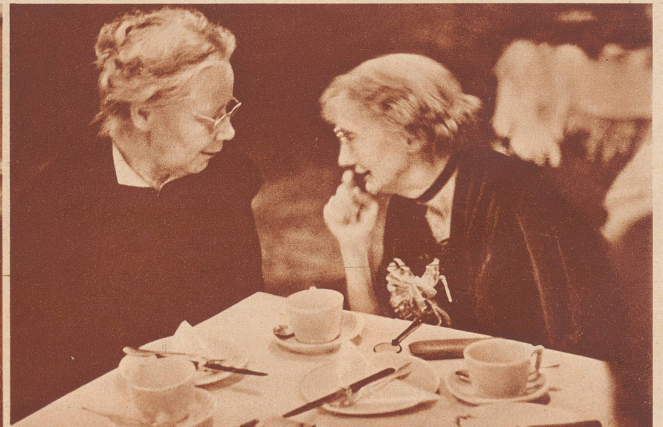
Ungenannte Teilnehmerinnen und Verfechterinnen der weiblichen stärkern Mitarbeit am staatlichen Leben. Déléguées et participantes au congrès.