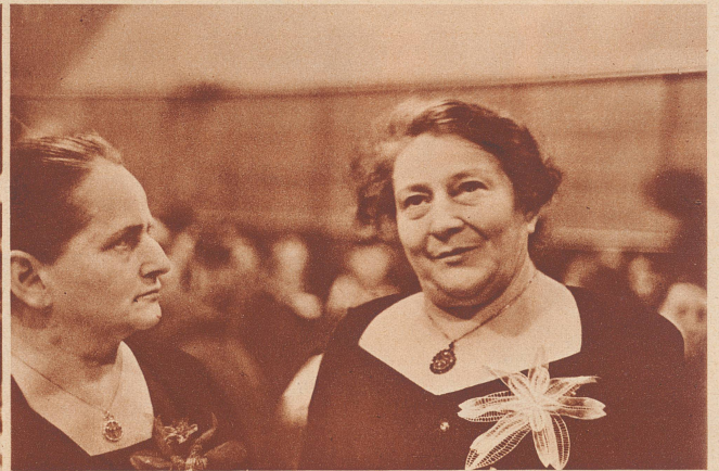
Frau Plaminkova, Senatorin in der tschechischen Nationalversammlung, eine temperament- und humorvolle Vortragsrednerin. Madame Plaminkowa, Sénateur de Tchécoslovaquie.