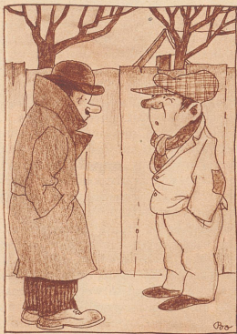
Serenade einst . . . . . und jetzt Sérénade jadis . . . . . aujourd'hui

«Los Heiri, häsch du e kein alte Ueberzieher für mich?» «Woll, aber er wird d'r z'wyt si!» «Jä woher, ganz sicher nöd!» «Dann chasch en ja hole, er isch z'Genf une!» «Bisch verruckt – ich cha doch nöd uf Genf abe reise wäge me-n-alte Ueberzieher!» «Ich ha d'r's ja grad gseit, er wird d'r z'wyt si!»