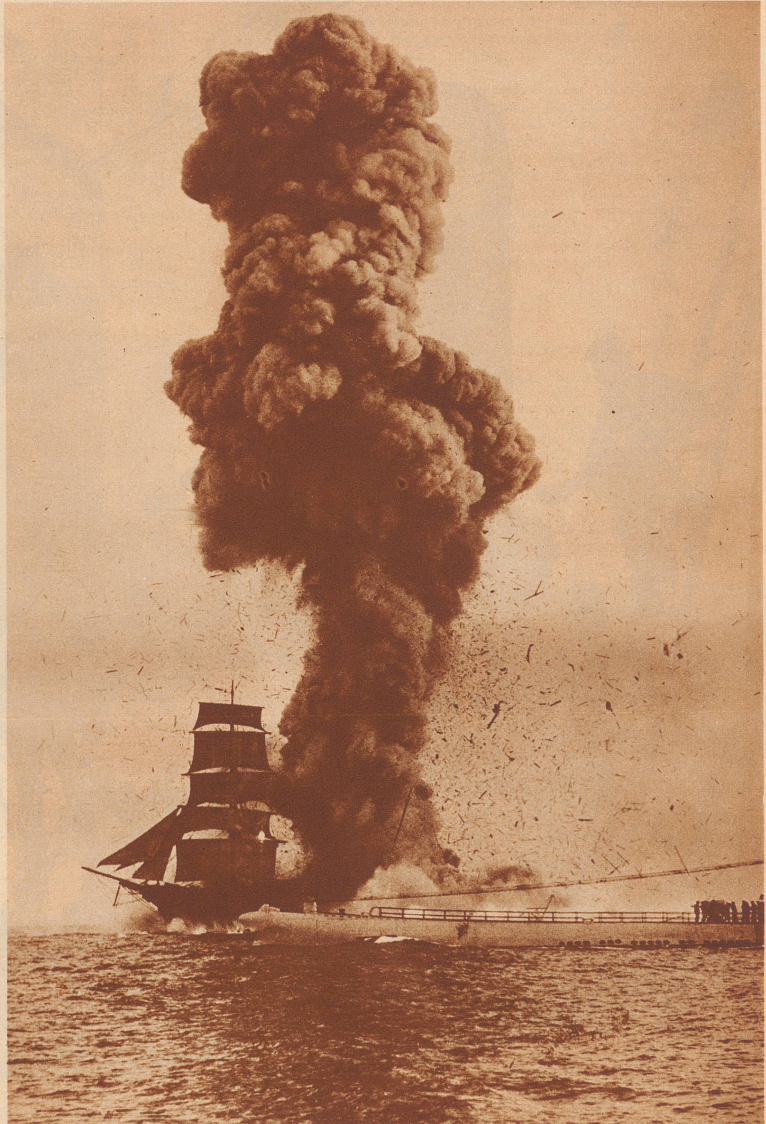
Bei den Manövern der Pazifik-Unterseebootflotte wurde ein alter aus-rangierter Dreimaster durch einen Torpedo zerstört. Das todbringende Unterseeboot ist rechts auf dem Bilde zu sehen. Eine riesige Rauchsäule entstieg dem Schiff, nachdem der Torpedo im Schiffsleib explodiert war.