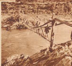
Schwebende Hängebrücke über den Pindori, einen Zufluß des Ganges. Pont de corde sur le Pindori, affluent du Gange.