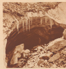
Müchige, künstliche Eingänge im oberen Teil des heiligen Sanoamp-Gießbrunnens. L'importante grille de la partie supérieure du glacier sacré de Sanoamp.

L'expédition suisse à l'Himalaya 1936 obtint — non sans peine — l'autorisation de parcourir le district de Garhwal. Quant à Milan, elle se rend à Badrinath, lieu de pèlerinage annuel de 50 à 100 mille Hindous qui viennent se baigner dans les sources chaudes au dans le torrent glacé de l'Alakanda, père du Gange, à la fin d'octobre. Le matériel prit fin. Tandis que le professeur Häm en profitait pour enrichir sa collection de documents photographiques et géologiques, le docteur Ganss entreprenait l'escalade d'un pic anonyme de quelque 6000 mètres. L'expédition établit encore un panorama photographique et géographique de l'Himalaya central, puis s'en fut le retour. Les deux unités qui se séparèrent, l'une venant par mer, l'autre venant «en Zurich» qu'il y eut en 2 jours et 22 heures.