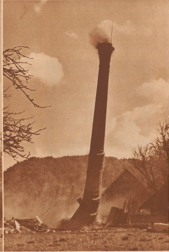
10 Uhr 50 Minuten 1 Sekunde:

Die eingeleitete Ladung ist explodiert und mit lauter Detonation explodiert. Sie hat in ungefähr 150 Meter Höhe die Kaminmauer herausgesprengt. Ein dicker grauer Qualm liegt über dem Boden und steigt langsam durch die Luft, aber der Kamin steht noch senkrecht.