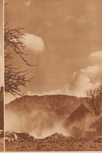
10 Uhr 50 Minuten 2 1/2 Sekunden:

Eine halbe Sekunde später ist die alte Bauwerk weiter gebrochen. Es ist nur noch halb so hoch wie zuvor, und bald wird es sich in seiner ganzen Länge auf die Seite geworfen haben.