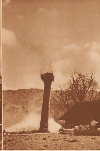
10 Uhr 50 Minuten 1 1/2 Sekunden:

Die Seite nicht schon schief, aber der Kamin neigt sich nach der Seite, wo unten die 1/4 der Mauer herausgesprengt wurde, aber auf 10 Meter Höhe und noch schon Brüche festzustellen. Oben raucht er zum letztenmal. Es ist der schwere Ruck der Sprengladung.