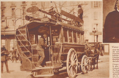
Victor Hugo lebte das Sinnbildliche. Seine demokratische Denkweise bewies er gerne auch dadurch zum Ausdruck, daß er im Omnibus ...