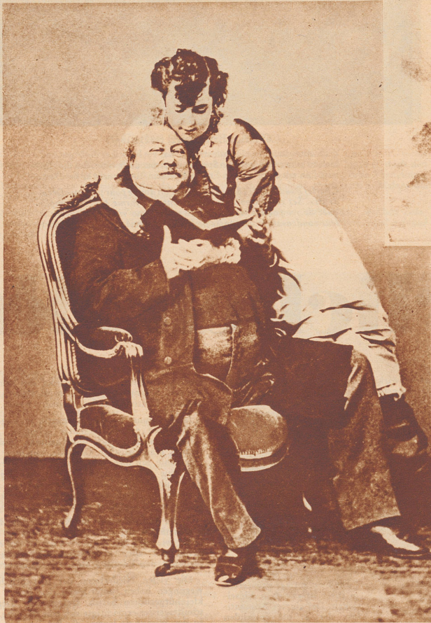
Alexander Dumas der Ältere (1802–1870)

Honoré de Balzac (1799–1850) fait époque dans la littérature française. Ses 100 romans et nouvelles, qui dépeignent la vie bourgeoise de son époque, marquent le début du Réalisme.