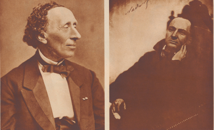
Der Däne Hans Christian Andersen (1805-1875) ...