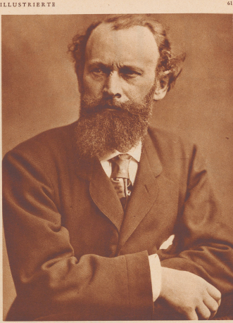
Edouard Manet (1832-1883)

der als französischer Maler ein Hauptvertreter der sogenannten romantischen Schule war. Wenn ...