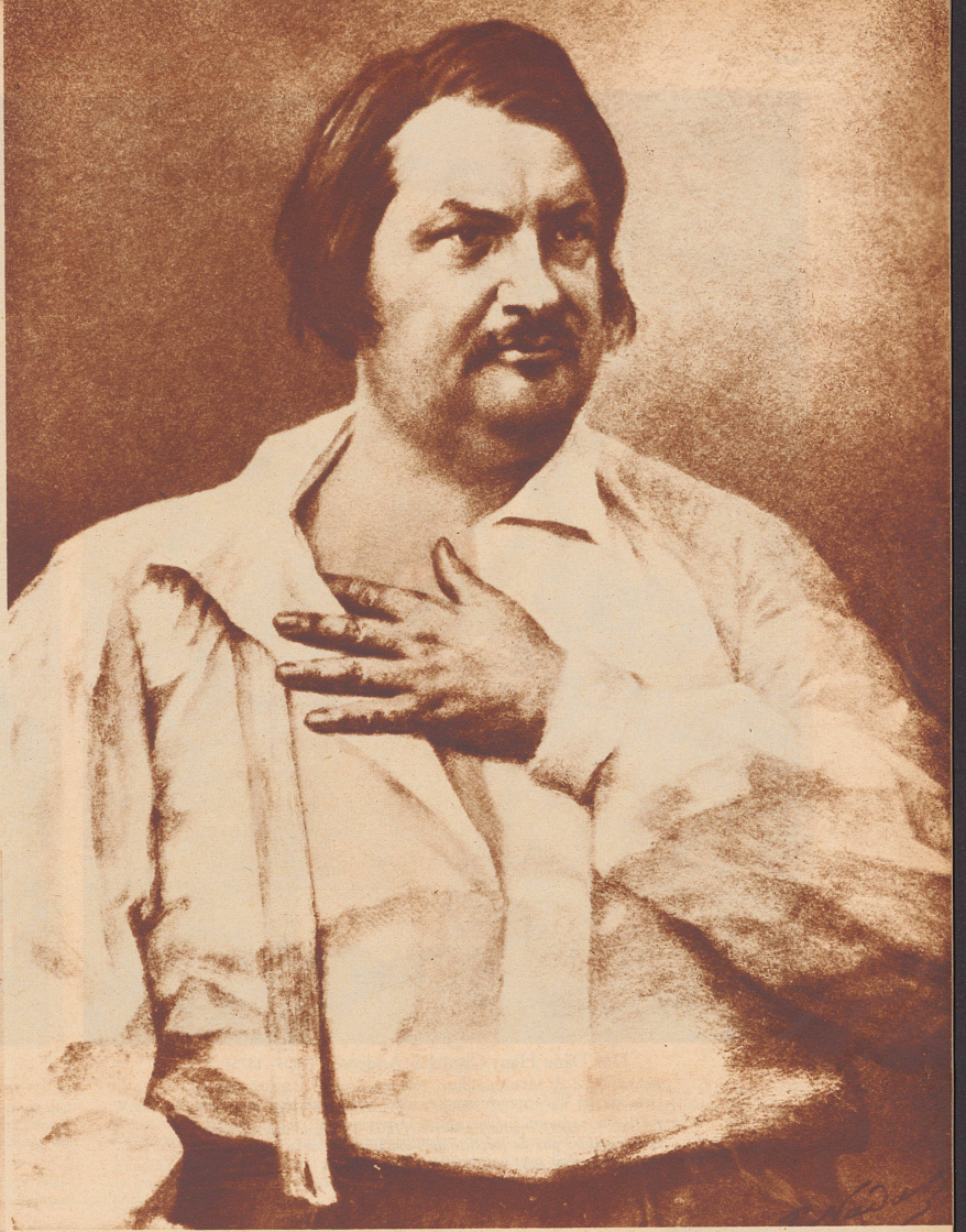
Honoré de Balzac (1799–1850)

Charles Dickens (1812–1870). L'humour en plus, sa situation littéraire en Angleterre est comparable à celle de Balzac en France. Dans ses nombreux romans de mœurs, il a combattu avec rage l'égoïsme et l'hypocrisie.