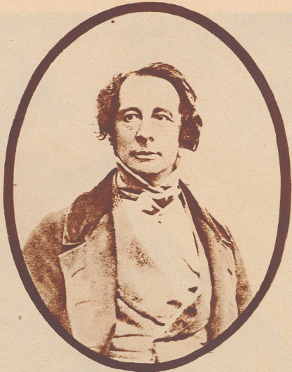
Charles Dickens (1812–1870).

Er begann als Journalist und entwickelte sich dann zum humoristischen Schriftsteller und satirischen Zeitschilderer großen Stils. Man könnte ihn den englischen Balzac nennen.