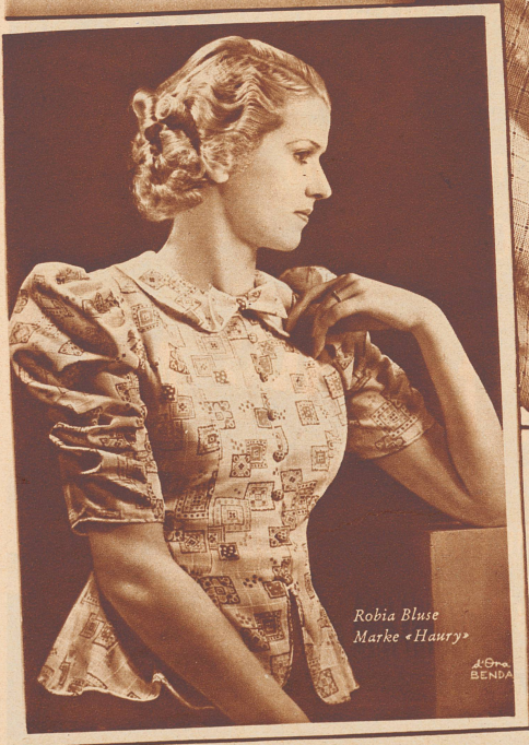
Robia Bluse Marke «Haury»