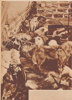
Die Hunde auf der Seefahrt von der Ost- zur Westküste Grönlands. Les chiens sur le bateau qui transportent l'expédition sur les côtes ouest de Grönland.

Die Verdienste der Hunde um das Gelingen der «Französischen Transgrönland-Expedition 1936/37»