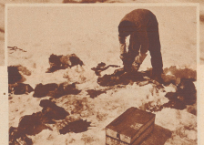
Der Mohr hat seine Billik getan. Dines Schillerische Zitat aus «Finns» Köstler man sein Tier angewandt zu dem Bild geben. Auf dem Mohr ist ein gewöhnliches Hund werden geben und ihr Fleisch den anderen Hunden verfrachten. Hier haben zwei Hunde das Leben gelassen. Perez sei dabei, sie in Stücke zu reißen, damit jeder der übrig gebliebenen Hunde seine Ration erhält. Une seule bœuf. Les chiens les plus faibles ont été abattus. Leur viande servit de nourriture aux autres bêtes. Perez accompli le dégoût et répartit le pain.