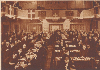
Der geräumige Turniersaal im Volkshaus in Bern, in dem die Vertreter von Dänemark, Tschechoslowakei, Frankreich und der Schweiz ihre Kräfte maßen.

2) Nun läßt auch Weiß die stärkste Fortsetzung aus, nämlich f4—f5! Da dann Schwarz Lc8×f5 wegen g2—g4 und Figurverlust nicht nehmen darf, bleibt der schwarze Läufer unentwickelt. Auch die Dame kann das Feld f6 wegen f5—f6 (Zerstörung des Königsflügels) nicht verlassen. Auf Tf8—d8 würde Tc3—d3 folgen und Schwarz müßte, um Td3—d6 zu verhüten, den Turm tauschen, worauf Weiß mit e3—e4—e5 erfolgreich fortsetzen könnte.